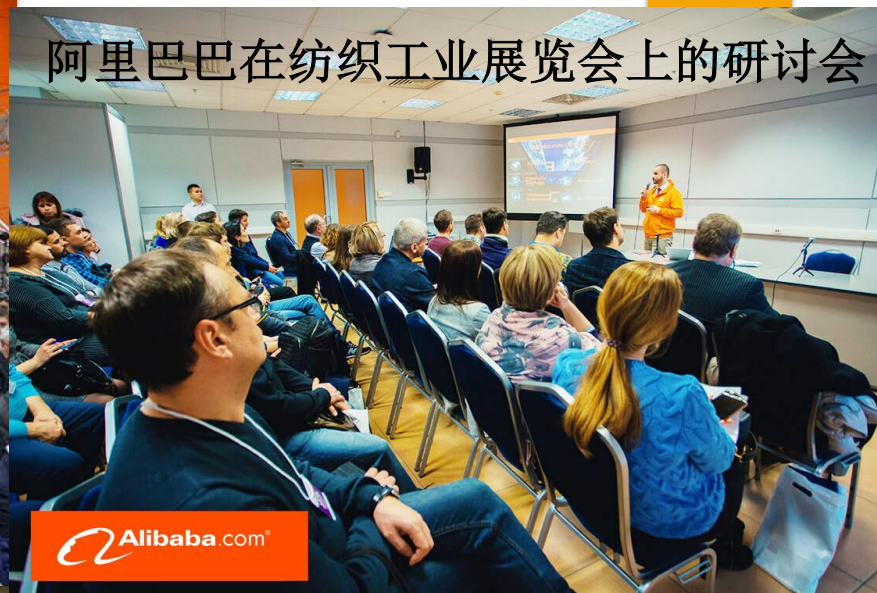
阿里巴巴在纺织工业展览会上的研讨会